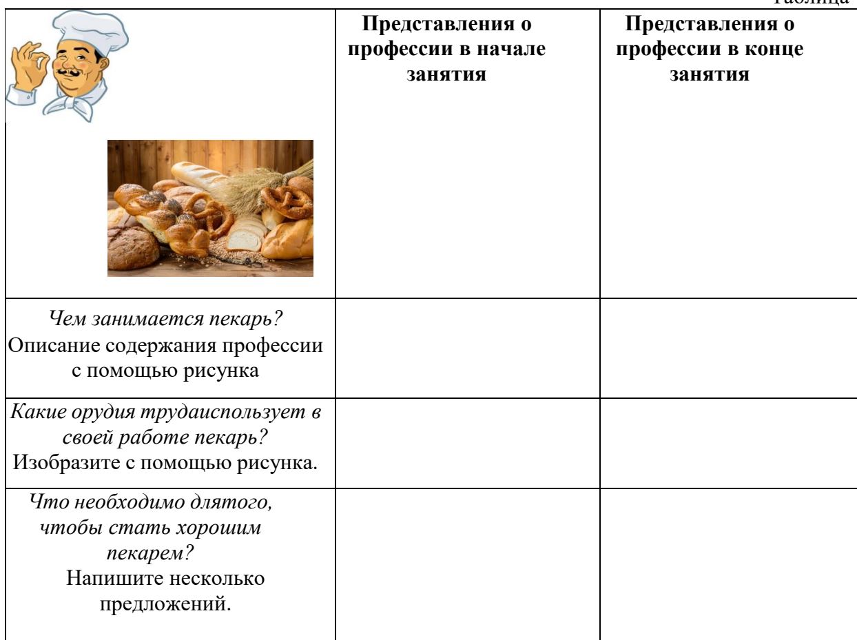
Приложение № 1 Таблица 1

4.2.Задание. Работа с пластилином. Необходимо вылепить пирог к какому-либо торжественному событию (на выбор). Например: к свадьбе, дню рождения мамы, к рождению ребенка, встрече с друзьями, пикнику, поездке на поезде и т.д. При выполнении задания можно использовать дополнительные материалы (краски, плотную цветную бумагу, природные материалы). После выполнения задания можно устроить выставку работ в классе.